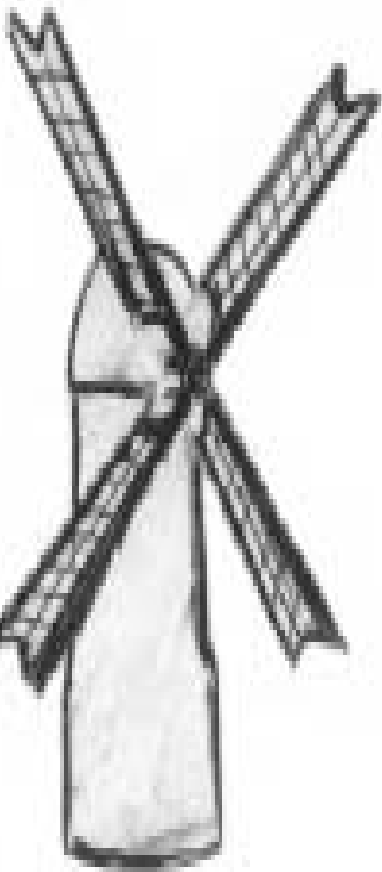
Рис. Цокотухиной Анны