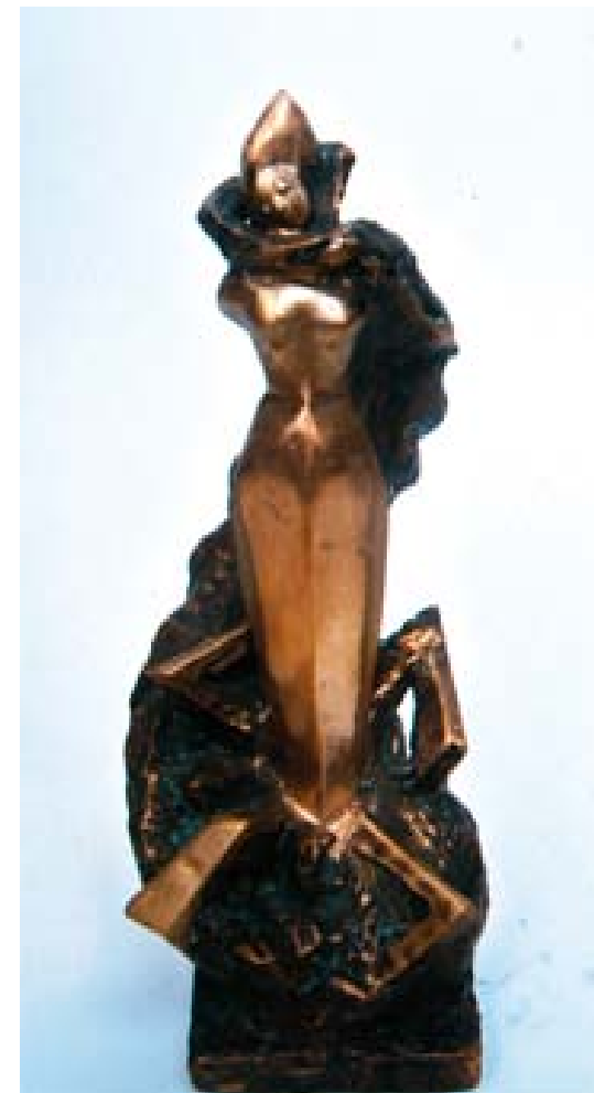
Смертью – смерть поправ... (Зое Космодемьянской)

Сложность обнаружения элемента StS и помещения его данных в таблицу Менделеева заключается в том, что он возникает только во вращающейся плазме Солнца, Земли и других планет. Если для плазмойда прародителем является