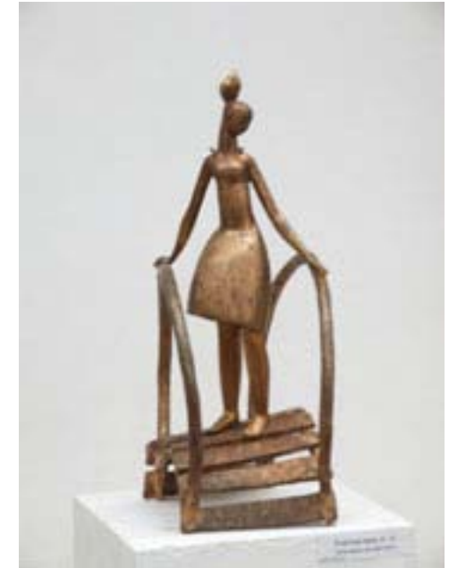
Девушка на мостике

13. Продвижение в правительство, в президентство, в Госдуму, в Совет Федерации долларовых миллиардеров и миллионеров, дураков, делающих деньги , это очередные заморочки бездарной элиты – улучшить жизнь в России.